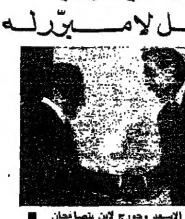
الرئيس الاسعد وجورج ليد يتصاحبان

لما الرئيس كامل الاسعد والسيد جورج ليد، القام بالاممال الامريكي في بلونه، ترك على الوضع في الجنوب، ويوقف اسرائيل من دخول قوات الردع العربية الى المنطقة الحدودية. وعلم ان السيد ليد نصح الرئيس الاسعد بوجوب الترتيب بادخال قوات الردع الى مناطق الحدود خوفا من ردة الفعل الاسرائيلية. ولم يشا القام بالاممال الامريكي الاصح عما دار في الاجتماع واكتفى بالتكلم مع رئيس مجلس النواب في الموضوع العامة المطروحة في لبنان والشرق الاوسط. اما الرئيس الاسعد فقد قال: لقد تناول حديثا مع القام بالاممال الامريكي السيد جورج ليد قضية وجوب دخول قوات الردع العربية الى منطقة الجنوب لوضع حد لحالة الفوضى والفرار التي القام هناك. وشرحا له ما تصور من خطيات وراء رفض اسرائيل دخول القوات العربية، وهذه الخطيات هي ان اسرائيل تتردد بالخوف من وجود هذه القوات على حدودها هذا الفوضى الذي لا يبر له، ان القوات العربية من سورية او غير سورية، لا يمكن لها في الطرف الاخر ان تتخذ من مهبها في الحافظ على الامن في لبنان، منطقة لاجبية اسرائيل، فضلا عن ان المرحلة الحالية هي مرحلة بحث عن السلام في اطار التوافق الدولي.